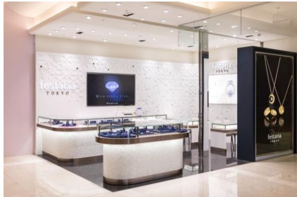
festaria TOKYO 新光三越百貨信義 A8 店